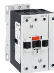
Stycznik mocy BF40